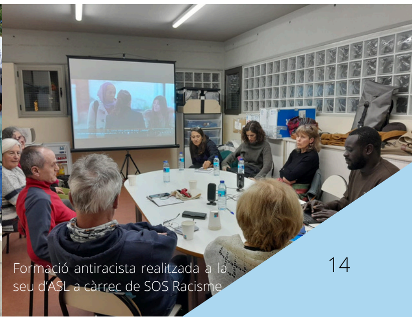
Formació antiracista realitzada a la seu d'ASL a càrrec de SOS Racisme