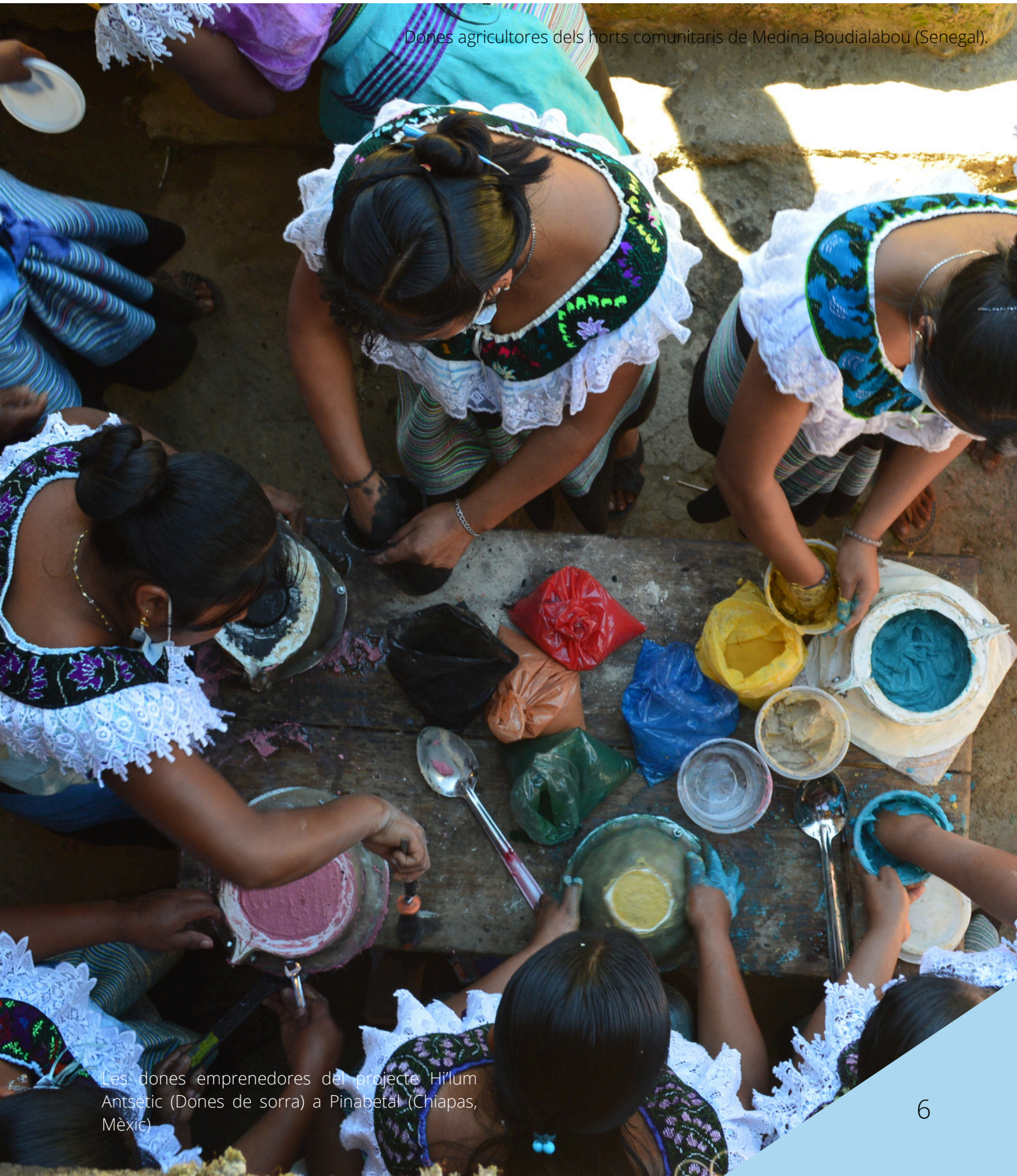
Les dones emprenedores del projecte H'illum Antsetic (Dones de sorra) a Pinabetal (Chiapas, Mèxic)