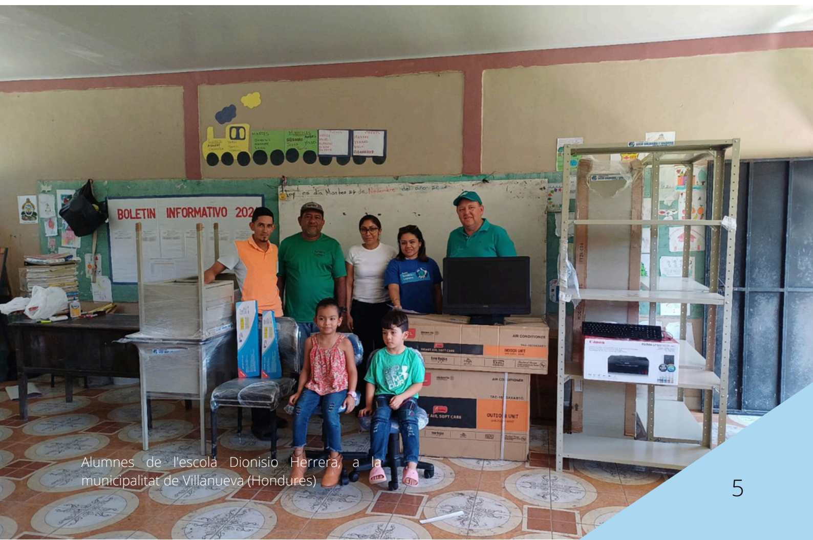
Alumnes de l'escola Dionisio Herrera, a la municipalitat de Villanueva (Hondures)

Tanmateix, l'ONG actualment treballa en projectes de sensibilització a Catalunya que permetin generar una societat compromesa amb la justícia global i amb un món més equitatiu.