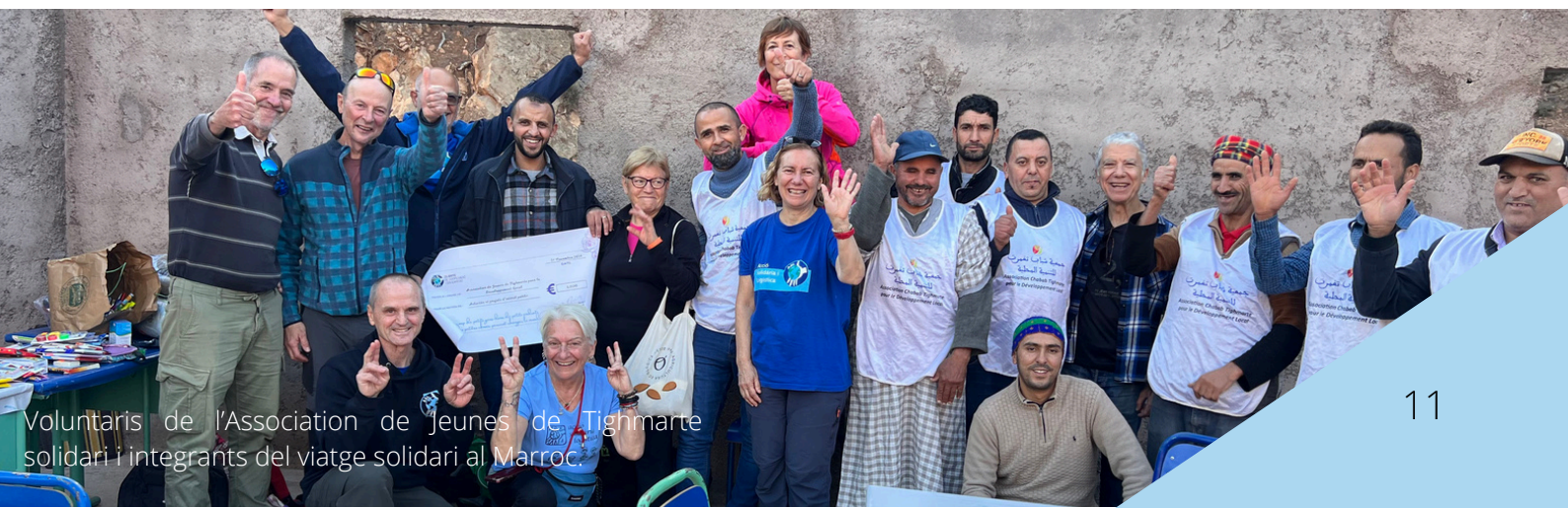
Voluntaris de l'Associació de Jeunes de Tighmarte solidari i integrants del viatge solidari al Marroc.

Aquest nou enfocament de viatge solidari, que combina acció humanitària, sensibilització i activitats esportives i culturals, ha estat una experiència transformadora per als participants i un model que ens agradaria replicar en futures missions. La resposta positiva dels socis i de la comunitat ens anima a continuar treballant en aquesta direcció, enfortint els vincles entre voluntaris i territori i donant suport a iniciatives que realment marquen la diferència.