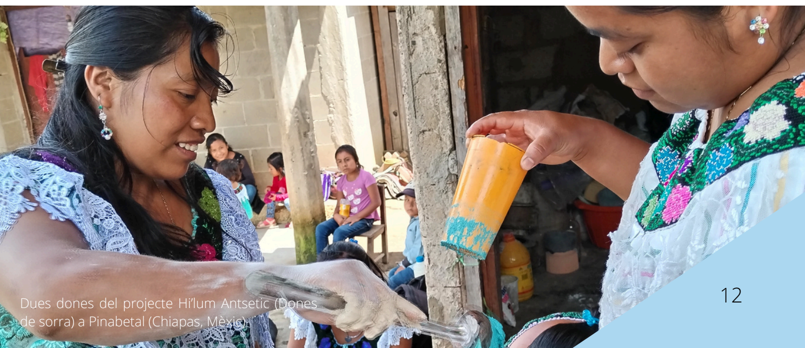
Dues dones del projecte Híllum Antsetic (Dones de sorra) a Pinabetal (Chiapas, Mèxic).

Actualment, IXIM treballa amb sis grups d'autofinançament i préstec. En el nostre cas, donem suport al projecte d'emprenedoria del Grup Híllum Antsetic (Dones de sorra): dotze dones de la comunitat de Pinabetal, al municipi de Chilón, que produeixen elements decoratius amb ciment. Aquest grup va començar el seu itinerari el 2019 i, fins al 2021, van rebre formacions sobre salut, alimentació i medi ambient. L'emprenedoria està formada per dotze dones pertanyents a un grup de finançament i préstec. A hores d'ara, ja han adquirit la formació i l'equipament bàsic per iniciar la producció i compten amb un catàleg de tres productes. Actualment, estan centrades a impulsar la comercialització i a consolidar l'emprenedoria mitjançant la creació de tres nous productes. L'objectiu final és que aquest projecte esdevingui un recurs econòmic estable per a la comunitat i les seves famílies.