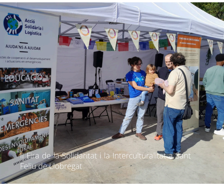
La Fira de la Solidaritat i la Interculturalitat a Sant Feliu de Llobregat