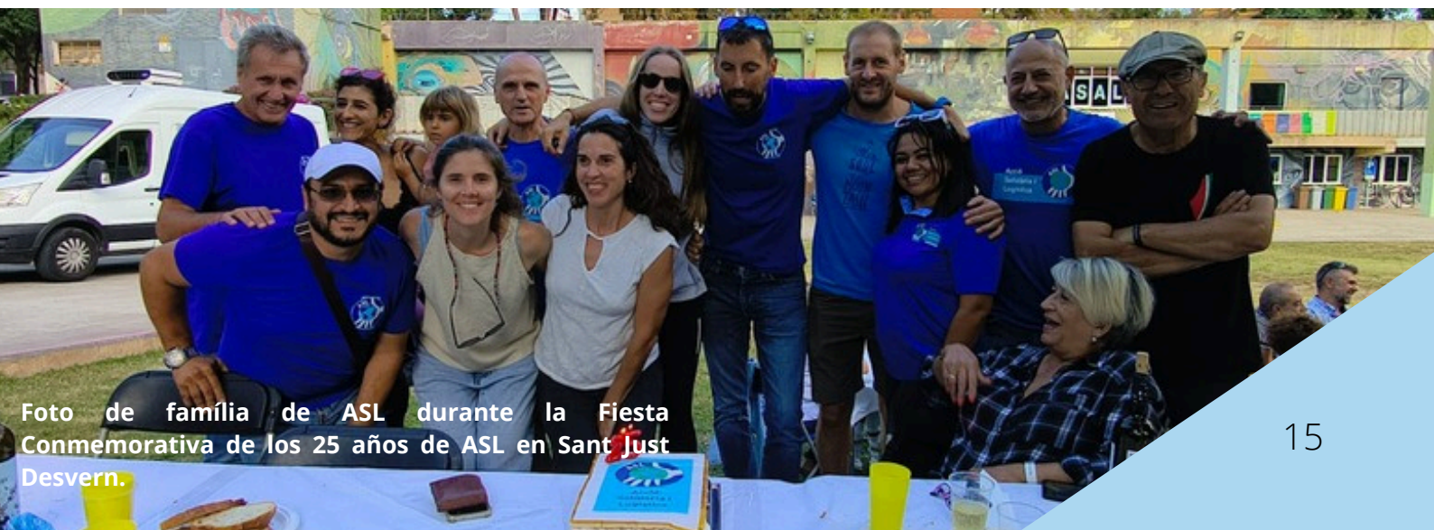
Foto de familia de ASL durante la Fiesta Conmemorativa de los 25 años de ASL en Sant Just Desvern.

Gracias a todas las personas por su participación y por estos 25 años caminados conjuntamente.