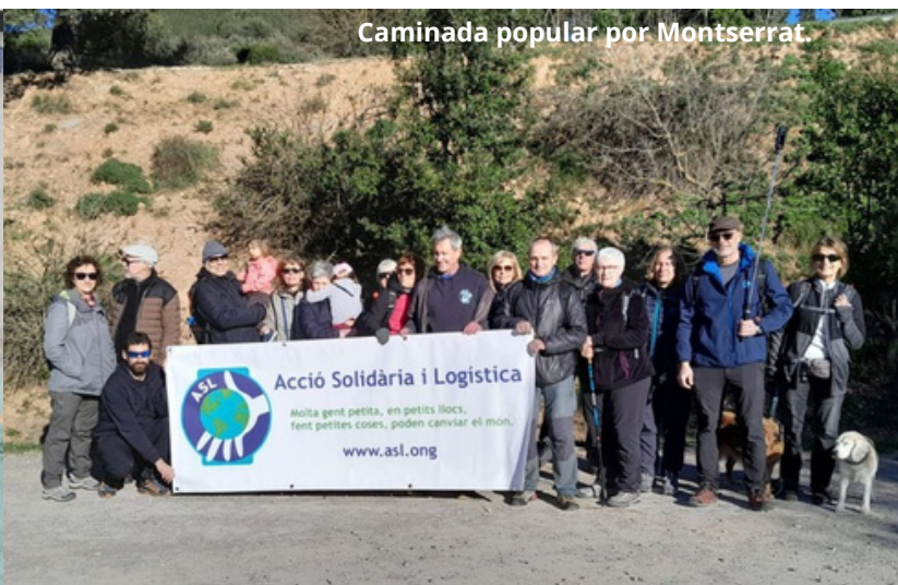
Caminada popular por Montserrat.