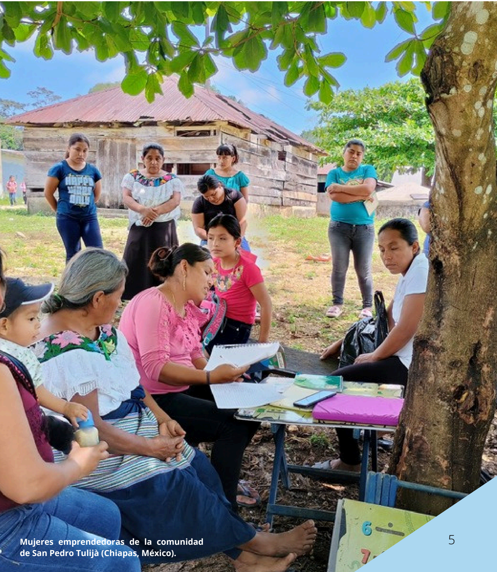
Mujeres emprendedoras de la comunidad de San Pedro Tulijà (Chiapas, México).

HONDURAS - MARRUECOS - MÉXICO - EMERGENCIAS