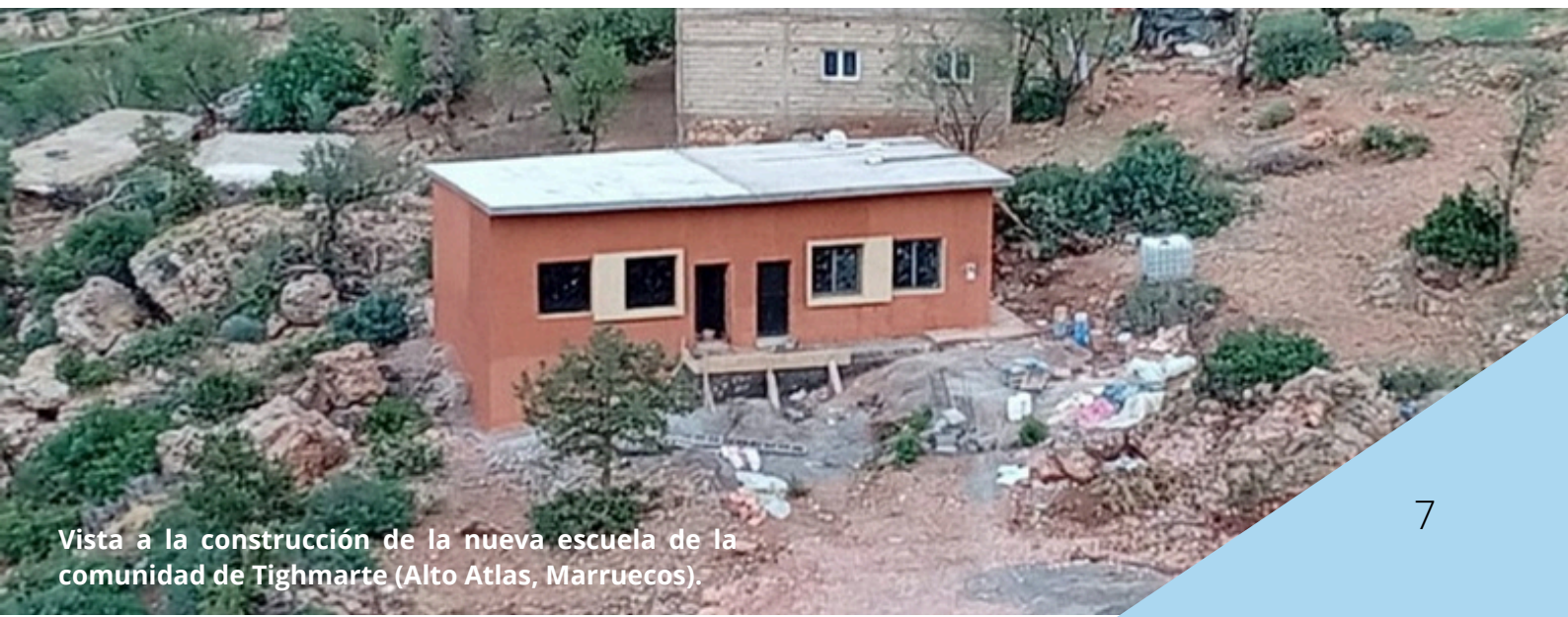
Vista a la construcción de la nueva escuela de la comunidad de Tighmarte (Alto Atlas, Marruecos).

Paralelamente, durante este año también se han iniciado reuniones de planificación con el objetivo de dar continuidad a la colaboración en los próximos años, consolidando los proyectos existentes y explorando nuevas líneas de trabajo conjunto.