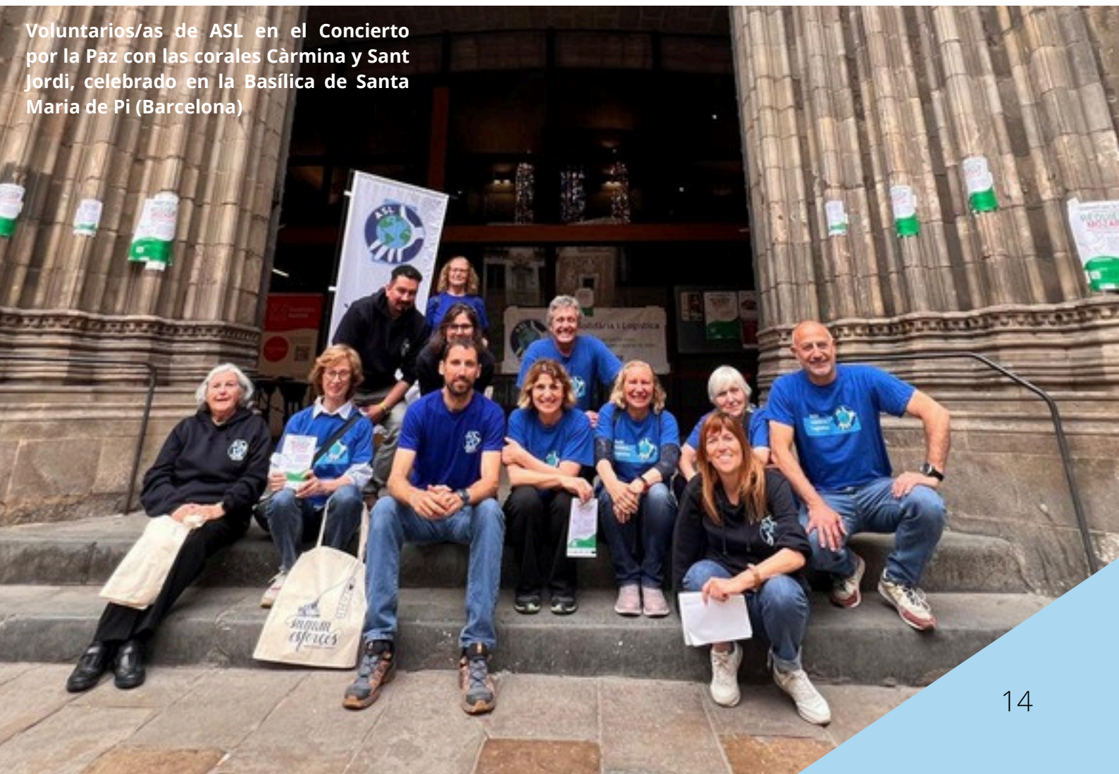
Voluntarios/as de ASL en el Concierto por la Paz con las corales Càrmina y Sant Jordi, celebrado en la Basílica de Santa Maria de Pi (Barcelona)

Fuera del ámbito municipal también hemos realizado y participado en otros actos públicos y de sensibilización como “La Nit del Fons”, organizada por el Fons Català de Cooperació al Desenvolupament; la colaboración con el Proyecto ReAcciona, en el que grupos de alumnado de dos institutos han realizado un cortometraje sobre ASL para dar a conocer nuestra actividad; la charla anual al alumnado de segundo curso del Ciclo Formativo en Emergencias del INS La Guineueta (Barcelona); dos actividades de recaudación de fondos para los proyectos en Nepal, con un Bingo Solidario en el Camping Vilanova (Vilanova i la Geltrú) y la actividad de danza Alma Calí; y, por último, hemos dado apoyo a la Fundación Enfermeras de Barcelona en su presentación oficial.