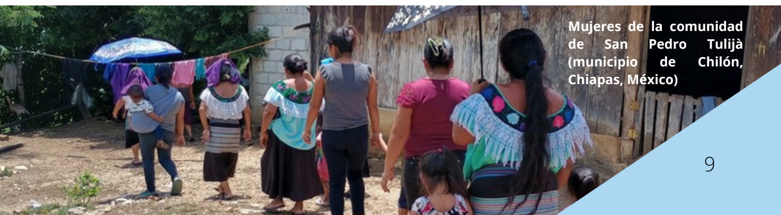
Mujeres de la comunidad de San Pedro Tujilà (municipio de Chilón, Chiapas, México)

Otro aspecto interesante en el proyecto de IXIM es la voluntad de generar una comercialización estable y sostenible de las producciones de los diferentes emprendimientos que acompañan. Actualmente, están trabajando para poner en marcha una comercializadora comunitaria y una red de distribuidores voluntarios que debe facilitar la compra de productos y la expedición de pedidos. A pesar de los grandes esfuerzos y recursos destinados, aún no ha sido posible consolidarla debido a diversas trabas legales y administrativas. A pesar de todas las dificultades, el plan de comercialización sigue siendo un objetivo estratégico que debe convertirse en una herramienta clave para la autonomía económica de las comunidades.