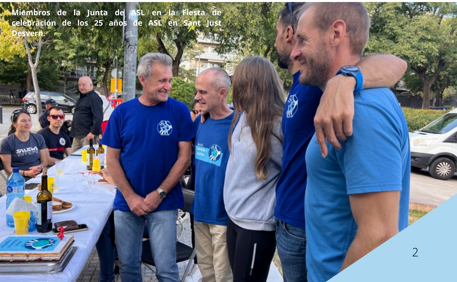
Miembros de la Junta de ASL en la Fiesta de celebración de los 25 años de ASL en Sant Just Desvern.