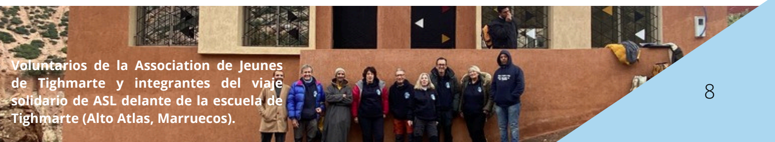
Voluntarios de la Association de Jeunes de Tighmarte y integrantes del viaje solidario de ASL delante de la escuela de Tighmarte (Alto Atlas, Marruecos).

Esta experiencia de viaje solidario ha sido valorada de manera positiva tanto por las personas participantes como por la comunidad, y ASL estudiará la posibilidad de continuar realizando este tipo de estancias en el futuro, como herramienta para conocer de cerca los proyectos, reforzar la relación con las comunidades y favorecer una cooperación basada en la proximidad y el trabajo conjunto.