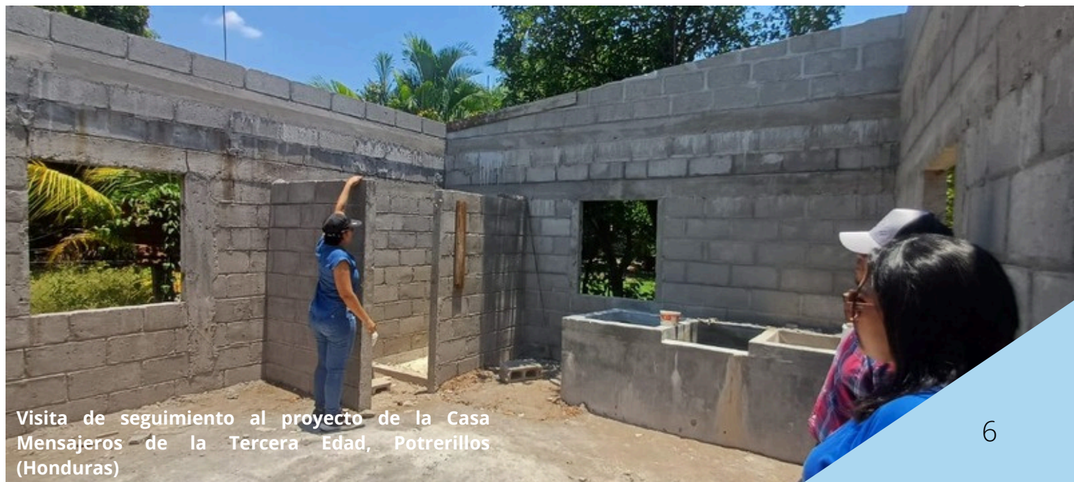
Visita de seguimiento al proyecto de la Casa Mensajeros de la Tercera Edad, Potrerillos (Honduras)

Aunque el proyecto no se ha podido completar en su totalidad durante este año, principalmente a causa de los tiempos de ejecución de la obra y de diversas paradas en la mano de obra, la valoración de lo realizado es muy positiva. Actualmente, los trabajos continúan planificados con el objetivo de finalizar la rehabilitación completa del equipamiento durante abril de 2026, consolidando así un espacio adecuado para la atención de las personas mayores del municipio.